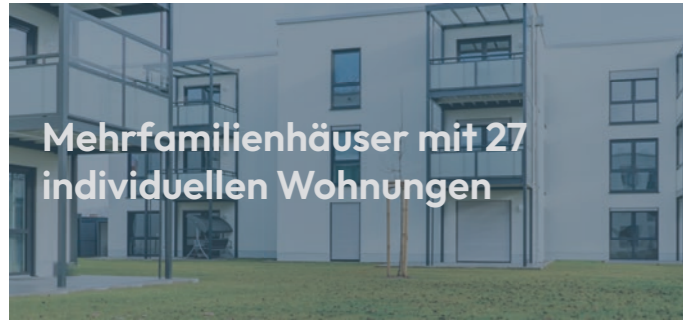
Mehrfamilienhäuser mit 27 individuellen Wohnungen