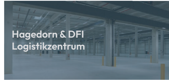
Hagedorn & DFI Logistikzentrum

In Hamburg-Billbrook entsteht auf einer revitalisierten Brownfield24-Fläche ein neues Mechatronik-Zentrum. Nach dem Rückbau der Bestandsgebäude und der Baugrundverbesserung mittels CMC®-Säulen liegt der Fokus des Projekts auf einer nachhaltigen Bauweise. Die Konstruktion des Gebäudes erfolgt überwiegend mit Stahlbetonfertigteilen. Auf Wunsch des Bauherrn wird das Dachtragwerk in Holzbauweise ausgeführt, um die Nachhaltigkeit des Projekts auch architektonisch sichtbar zu machen. Das Projekt verbindet moderne Industrie-architektur mit ökologischer Verantwortung und innovativen technischen Lösungen. So leistet das neue Mechatronik-Zentrum einen wichtigen Beitrag zur nachhaltigen Entwicklung des Standorts und setzt Maßstäbe für zukunftsorientiertes Bauen im Industriebereich.