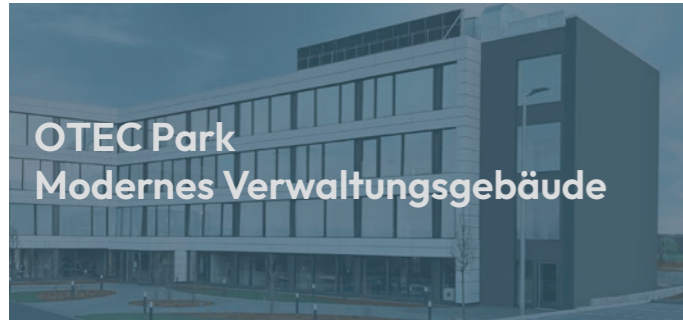
OTEC Park Modernes Verwaltungsgebäude