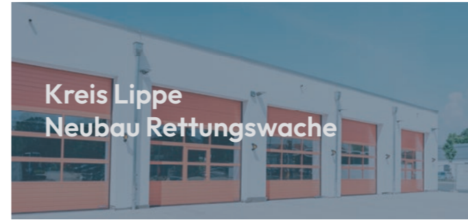
Kreis Lippe Neubau Rettungswache

Für unseren Auftraggeber Carestone Group GmbH haben wir in Rietberg ein modernes Seniorenheim mit betreutem Wohnen realisiert. Auf vier Etagen und einer Gesamtnutzfläche von über 5.000 Quadratmetern entstanden 15 großzügige Wohnungen, 80 komfortable Zimmer sowie ein weitläufiger Büro- und Verwaltungstrakt. Besondere Herausforderungen wie beengte Platzverhältnisse und eine aufwendige Wasserhaltung für die Baugrube konnten wir dank unserer Erfahrung und präzisen Planung souverän meistern. Nach nur 18 Monaten Bauzeit haben wir das Projekt termingerecht und schlüsselfertig übergeben.