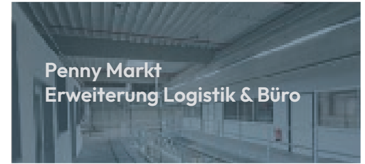
Penny Markt Erweiterung Logistik & Büro

In Lage haben wir für unseren Auftraggeber eine moderne Rettungswache im Passivhausstandard auf rund 1.000 m 2 realisiert. Das Gebäude umfasst eine 330 m 2 große Fahrzeughalle für vier Einsatzfahrzeuge, eine separate Desinfektions- und Waschküche sowie Umkleide- und Sanitärräume mit Schwarz-Weiß-Trennung. Der 560 m 2 große Verwaltungsbereich bietet Büro- und Lagerräume sowie großzügige Aufenthalts- und Ruhebereiche. Ein Highlight ist der moderne Schulungsraum, der als erster seiner Art im Kreis Lippe die fortlaufende Qualifizierung der Mitarbeitenden ermöglicht. Dank Passivhausstandard und Photovoltaikanlage erfüllt das Gebäude höchste Ansprüche an Energieeffizienz und Nachhaltigkeit – und setzt neue Maßstäbe für die zukunftssichere öffentliche Infrastruktur.