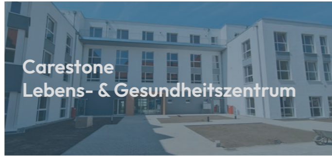
Carestone Lebens- & Gesundheitszentrum

In Lemgo haben wir für unsere Auftraggeber ein anspruchsvolles Wohnungsbauprojekt realisiert: 27 individuelle Wohnungen, verteilt auf drei moderne Mehrfamilienhäuser. Jede Wohneinheit überzeugt durch eine durchdachte Planung und hochwertige Ausstattung – inklusive Balkon und Fahrstuhl für maximalen Komfort. Auch die Gestaltung der Außenanlagen wurde von uns übernommen und harmonisch in das Gesamtkonzept integriert. Die Bauausführung erfolgte nach höchsten energetischen Standards: Die Anforderungen der ENEC wurden vollständig erfüllt, ebenso wie der Blower-Door-Test zur Luftdichtheit der Gebäude. Mit diesem Projekt beweisen wir einmal mehr unsere Kompetenz für effiziente, nachhaltige und kundenorientierte Bauprojekte im Bereich des modernen Wohnungsbaus.