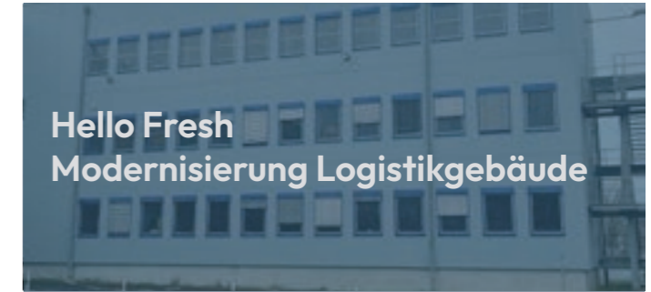
Hello Fresh Modernisierung Logistikgebäude

Ein Projekt mit Zukunft: Bei der schlüsselfertigen Errichtung dieses Logistikzentrums mit integrierten Büroräumen und umfassenden Außenanlagen standen neben der Funktionalität vor allem eine nachhaltige Planung und Bauweise im Vordergrund. Das Objekt überzeugt mit 12 Überladebrücken und 14 Sektionaltoren und wurde mit einer leistungsstarken Photovoltaikanlage, moderner LED-Beleuchtung und einer effizienten Wärmepumpenheizung ausgestattet. Es erfüllt die Anforderungen der Energieeffizienzklasse GEG 40 EE NH. Für die Belegschaft und Kunden stehen im Außenbereich Ladepunkte für Elektroautos und E-Bikes zur Verfügung. Im Sinne einer sicheren und nachhaltigen Zukunft war es dem Bauherrn und uns ein besonderes Anliegen, dieses Objekt nach den Kriterien der DGNB Gold-Zertifizierung zu realisieren.